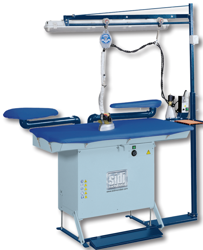
Venus-R + Bracci